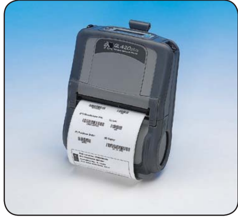
QL 420 Plus™

通过 Zebra QL 420 Plus 移动打印机的无线功能，可灵活打印 4 英寸标签或收据。QL 420 Plus 打印机结构坚固，能够在许多恶劣环境中工作，包括仓库、配送和配送记帐环境，它还提供移动安装选项，可供在叉车或卡车中打印。