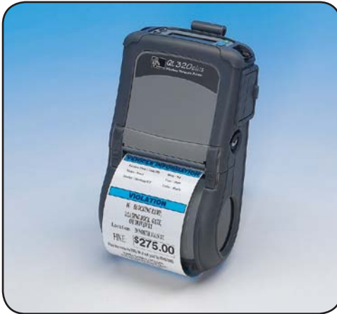
QL 320 Plus™

QL 320 Plus 移动打印机是 Zebra 的畅销产品，它的打印宽度可达 3 英寸，是第一款提供 802.11b/g 无线模块灵活性的打印机，能够满足不断变化的需求和无线标准要求。坚固耐用的机身设计使之能够在恶劣的生产或货物收发环境中使用。