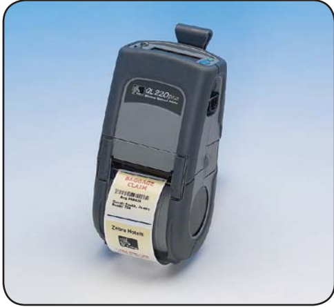
QL 220 Plus™

无论是在商店过道、医院内外还是零售药店柜台，QL 220 Plus 打印机对 2 英寸标签、票据和收据的打印能力都是固定式打印机和大型移动打印机无法比拟的。这款标签/收据移动打印机重量仅 1.04 磅，具有网络寻址功能，可用皮带或夹子佩戴，在行动中使用得心应手！